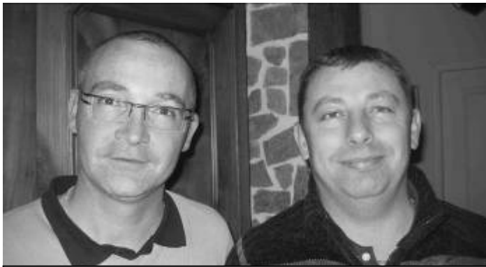
Une bonne ambiance, du respect et des résultats