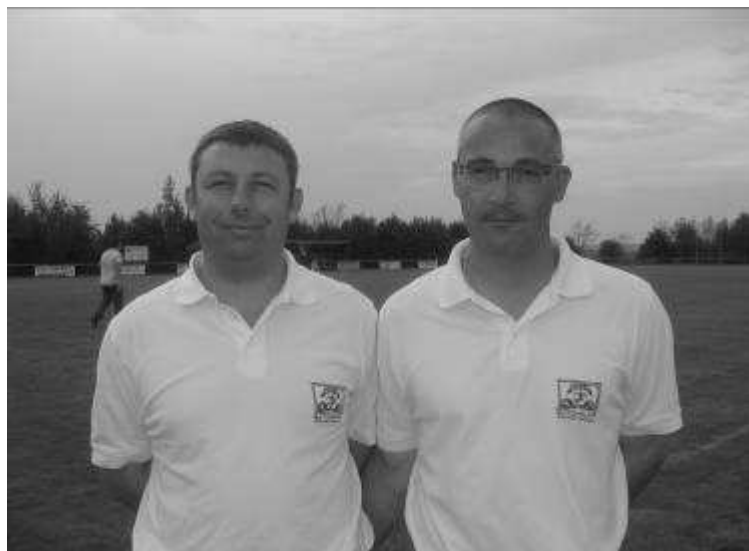
« Nous revenons au niveau que St Paul n'aurait jamais du quitter »

L'objectif pour l'équipe A était de remonter immédiatement en Promotion de 1 ère division. C'est chose faite. Nous étions à 2 journées de la fin mathématiquement assurés de terminer 1 er du groupe. Avec à la trêve un retard de 7 points sur Mesnard alors 1 er , nous terminons 1 er avec 12 points en plus sur ce club.